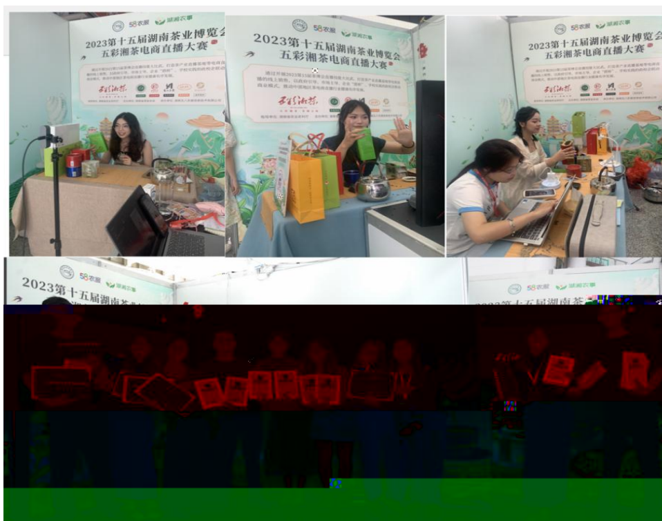
图 “湖南省第十五届茶博会” 电商直播比赛现场

播和方的，短 得的步。 队比 10多单、单， 包但不、等多个，的 和队得的高度。的 得不对公的，更对参 付出和的充分定。