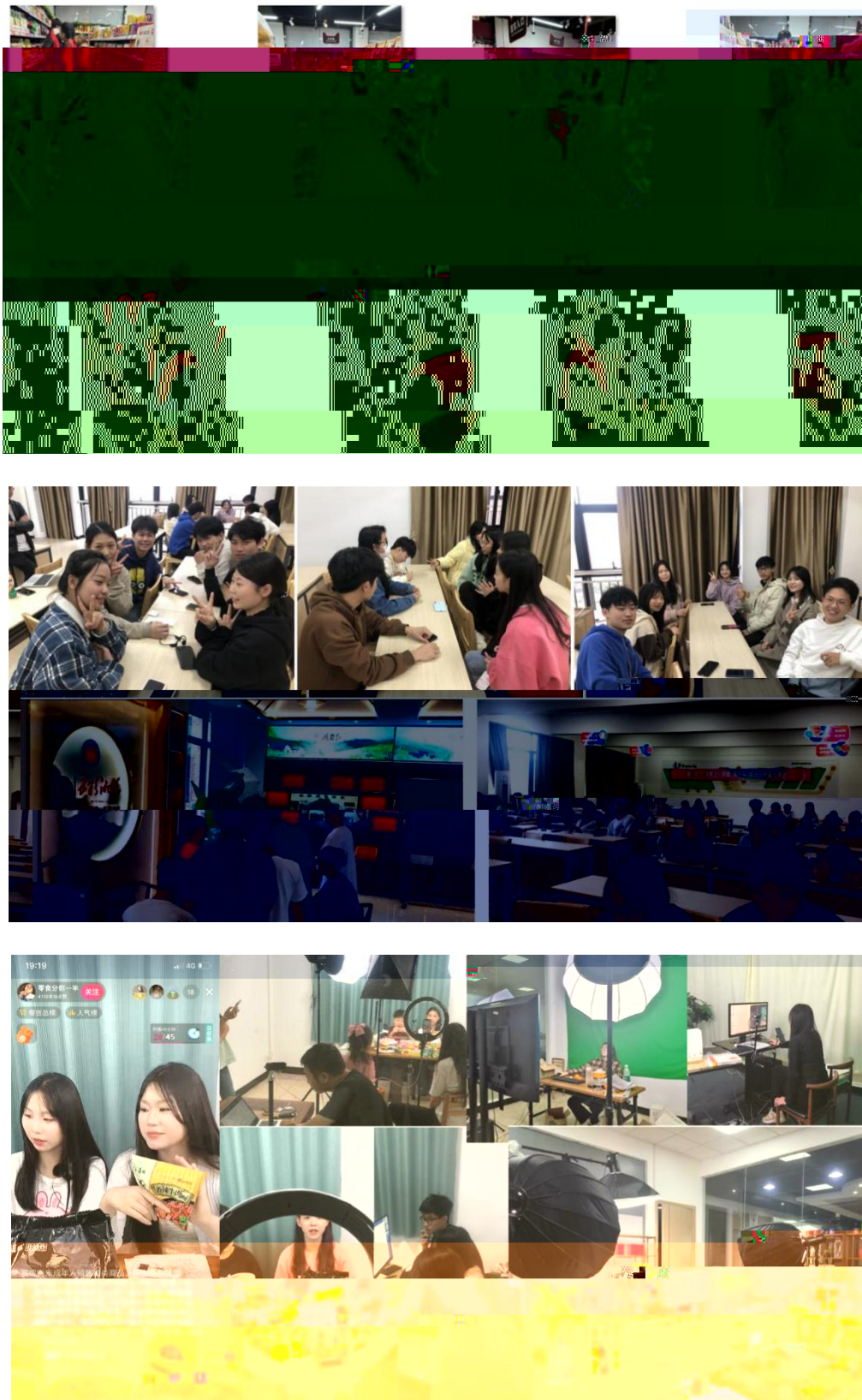
图 组织学生开展实习实训