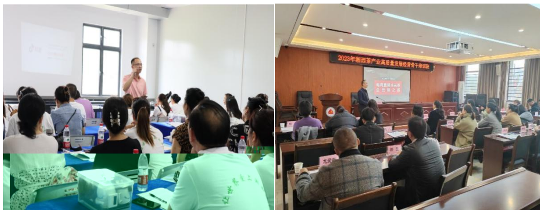
图 企业协助学校为湘西茶企开展电商直播培训

地的合，公不传 电，更关的创创。过大大 供创导，别茶工的操，公 鼓尝、敢创。方供锻 创的，方操的 合。